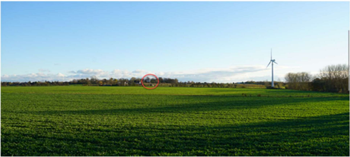
Set fra Nøddebovejen