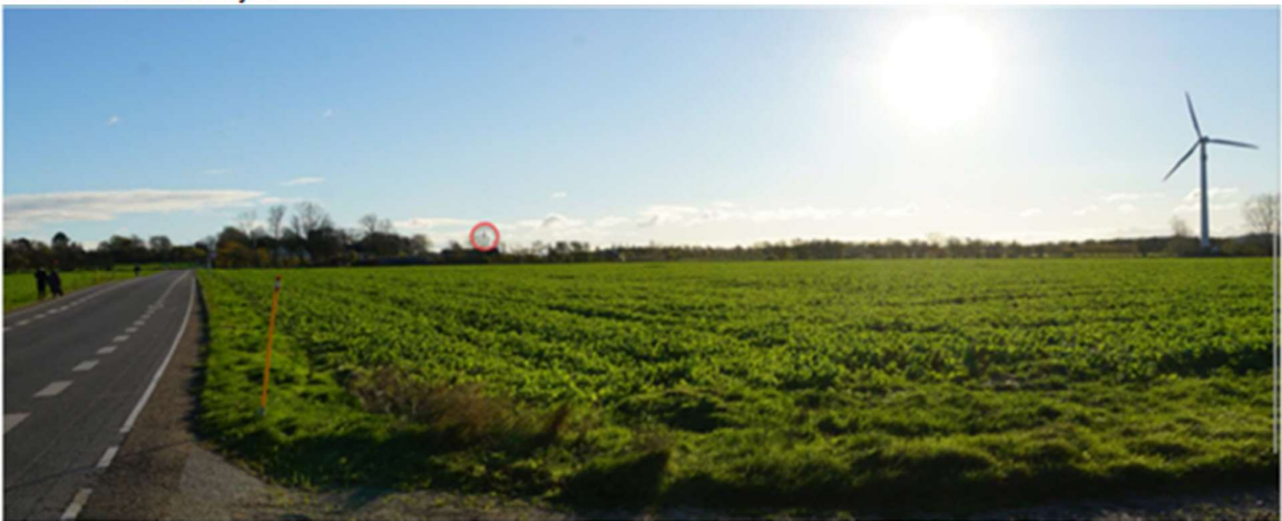
Set fra Haldvejen