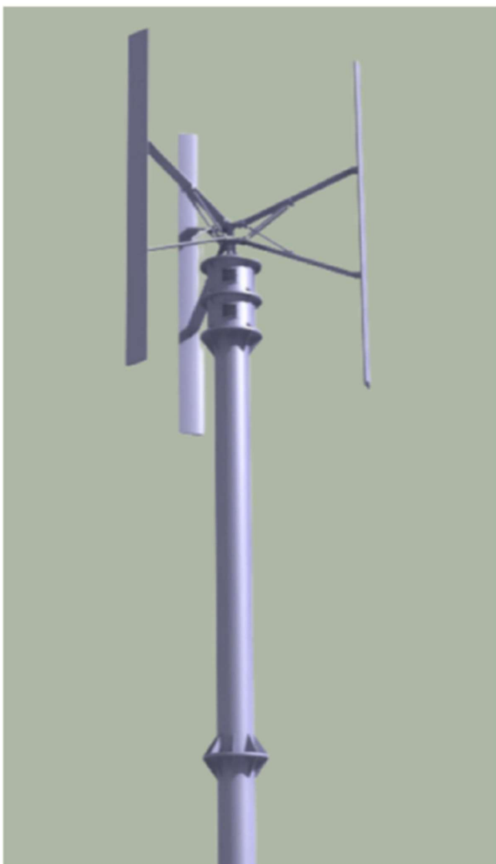
Øverste del af en mølle – ikke i mål. Masten består af to cirka lige store rør og toppen. Her ses det øverste rør og lidt af det nederste.